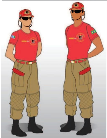
Figura 03 – Uniforme Interno

Art. 15 – Não é permitido alterar as características dos uniformes nem a eles