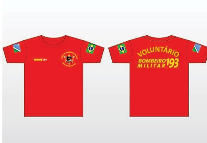
Figura 01: Camiseta Meia Manga Vermelha