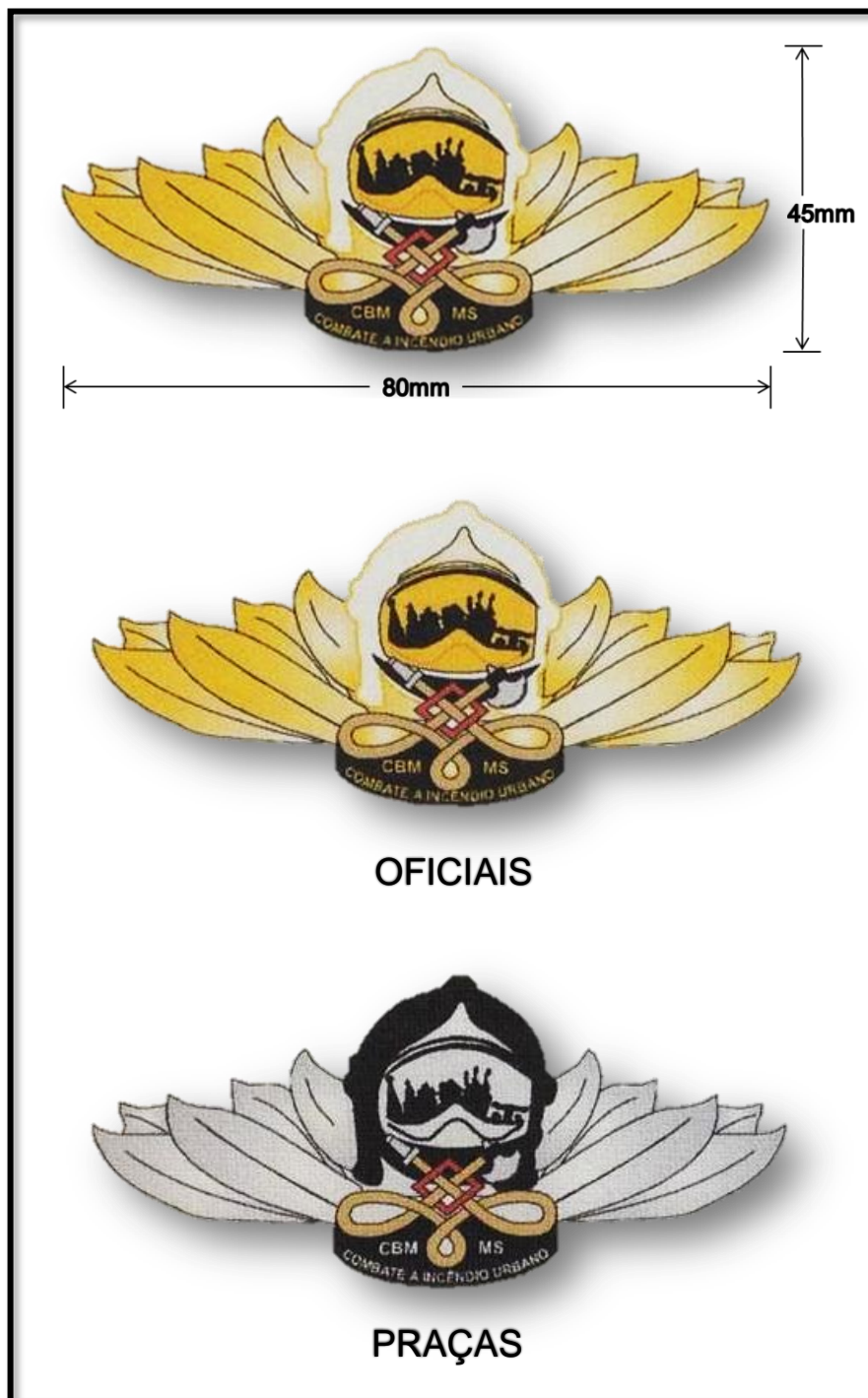
Indicativos de curso