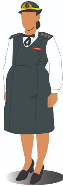
Figura 24 – UNIFORME G-1 (Solenidades)