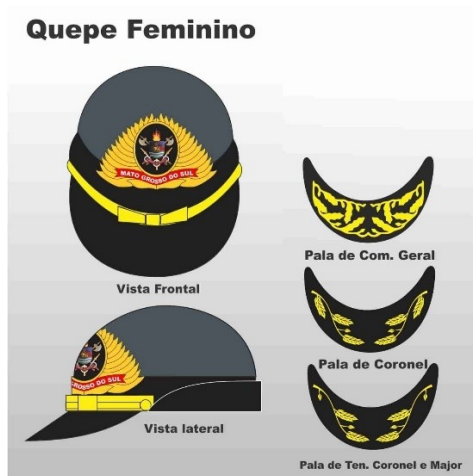
Figura 107 – Quepe Feminino