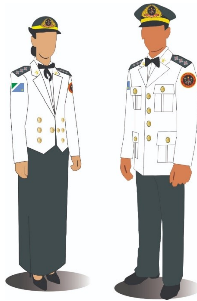
Figura 7 – UNIFORME 2º B