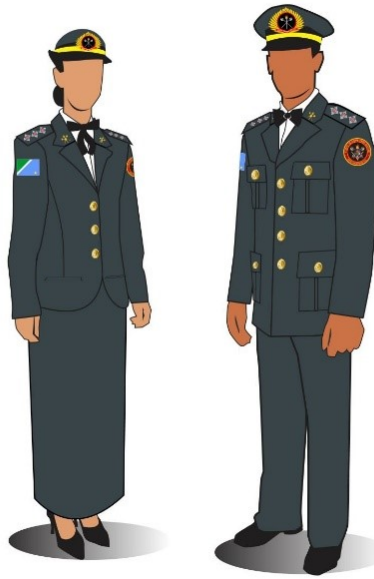
Figura 35-2 – UNIFORME 8º B